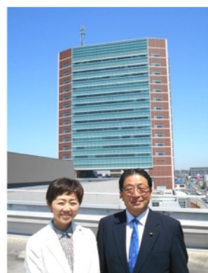
ベテランと新人 初登庁記念撮影